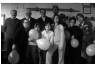
Foto di gruppo per la fine del corso di teatro