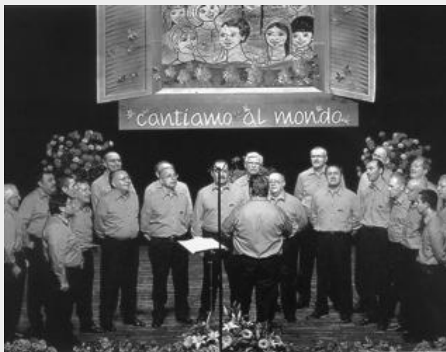
Un'immagine di una recente esibizione del Coro Monte Alben di Lodi: il 6 dicembre il prossimo concerto

estimatori dei coristi e che si concluderà poi con la cena sociale. Il 7 dicembre una trasferta nella chiesa di Vignate dove è in programma una rassegna alla quale parteciperà la locale Corale 80. È indubbiamente importante l'impegno previsto per il 17 dicembre, quando l'Alben canterà al Teatro Grande di Brescia in occasione del Festival regionale dei cori, una manifestazione patrocinata dalla Regione alla quale è stato invitato un coro in rappresentanza di ogni provincia lombarda. L'essere stati scelti a rappresentare la provincia di Lodi, è motivo di compiacimento per il sodalizio. Il 20 dicembre (ore 21) a Codogno, la partecipazione a una rassegna con il coro Gerberto di Bobbio. Negli anni scorsi ci si ritrovava nella chiesa dei Cappuccini ma ora nella stessa si stanno svolgendo dei lavori di ristrutturazione ed allora l'esibizione si terrà in un altro luogo, ancora da definire. Infine il 24 dicembre la Messa di Natale nella chiesa di Abbadia Cerreto, un appuntamento che si ripete da anni.